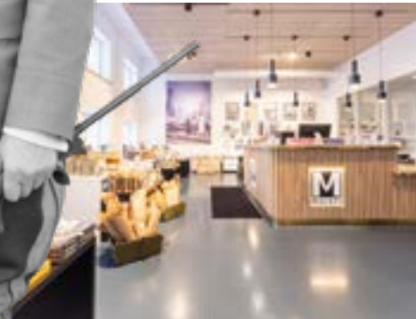
Kuva: Pihla Liukkonen Kontrastia